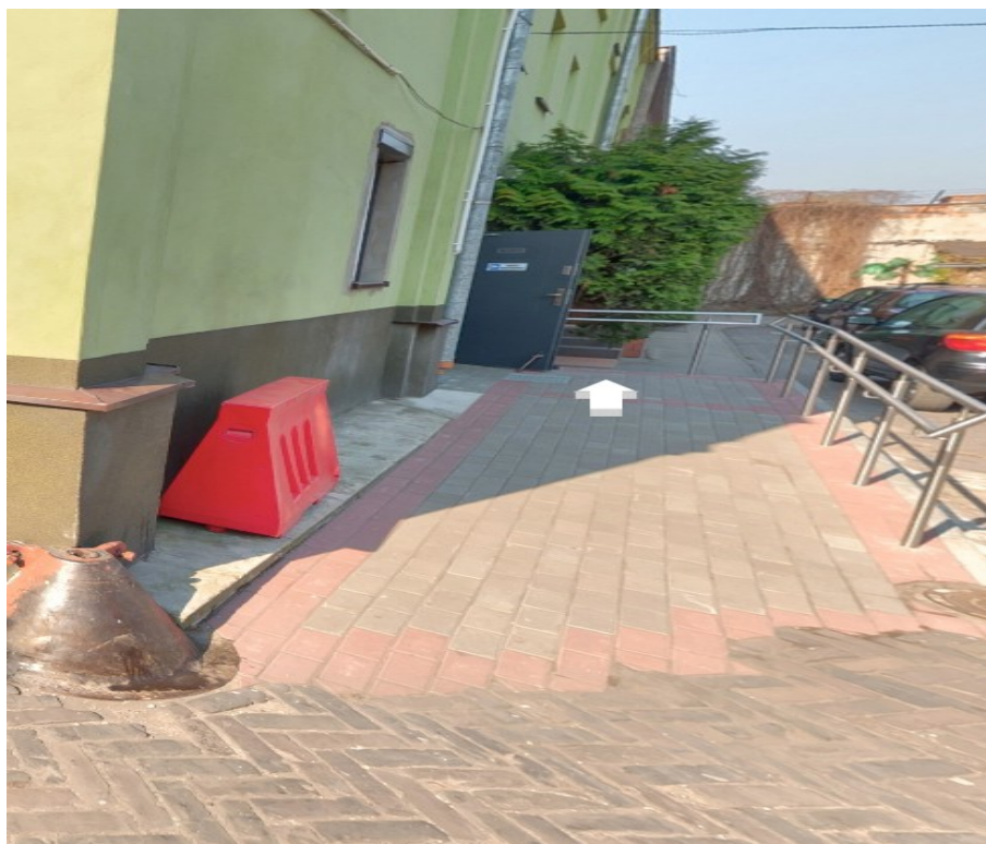
Wejście i podjazd do Centrum Aktywności Fabryczna 3 w Markach

Budynek jest dobrze oznaczony. Nazwa i adres są umieszczone w miejscu widocznym i łatwo zauważalnym. Do budynku prowadzi główne wejście od strony bramy po prawej stronie budynku. Drzwi, zarówno wejścia głównego są dobrze widoczne na tle fasady. Do wejścia głównego od strony ul. Fabrycznej prowadzą widoczne kierunkowskazy. Koło budynku wyznaczono 1 miejsce parkingowe dla osób niepełnosprawnych.