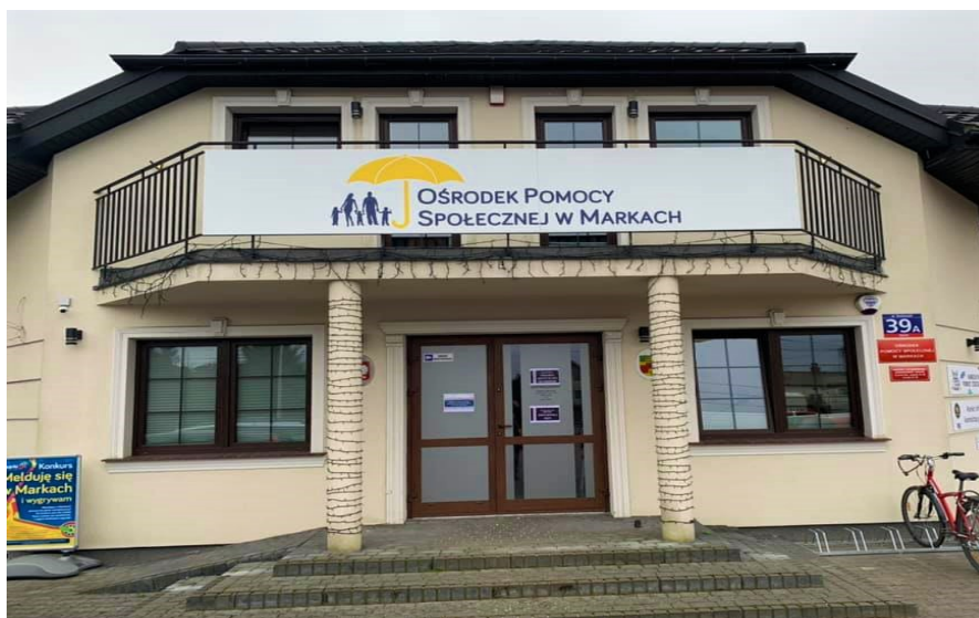
Budynek Ośrodka Pomocy Społecznej w Markach od strony ulicy Kościuszki

W celu pozostawienia korespondencji zapraszamy do budynku przy ulicy Kościuszki 39A w Markach do siedziby Ośrodka Pomocy Społecznej w Markach