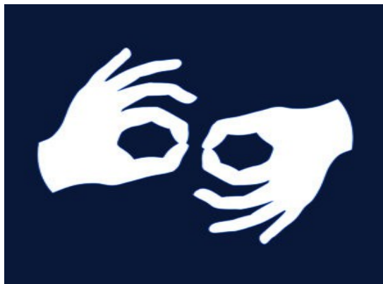
Obrazek tłumaczenie na język migowy

Urząd Miasta w Markach i Ośrodek Pomocy Społecznej w Markach zapewniają dostęp do świadczenia usług tłumacza języka migowego on- line . Skorzystanie z usługi jest bezpłatne i nie wymaga wcześniejszego umawiania się na wizytę. Ułatwieniem będzie powiadomienie wcześniej o chęci skorzystania z powyższej usługi.