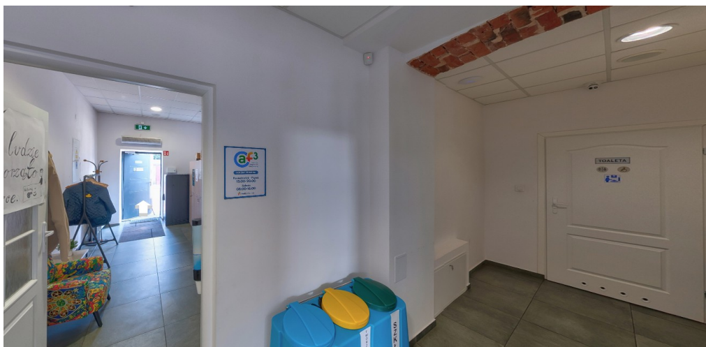
Korytarz z widocznymi drzwiami wejściowymi i do toalety

Korytarze są bezkolizyjne, nie posiadają progów, mają czytelny i intuicyjny układ. Dla osób na wózkach są one w pełni dostępne. Wydział w całości zlokalizowany jest na parterze, co zapewnia dostępność dla osób z niepełnosprawnościami.