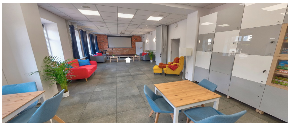
Pomieszczenie przyjęć osób na spotkanie Zespołu Gminnej Komisji Rozwiązywania Problemów Alkoholowych w Markach

Korytarz prowadzący do sali umawianych spotkań Zespołu